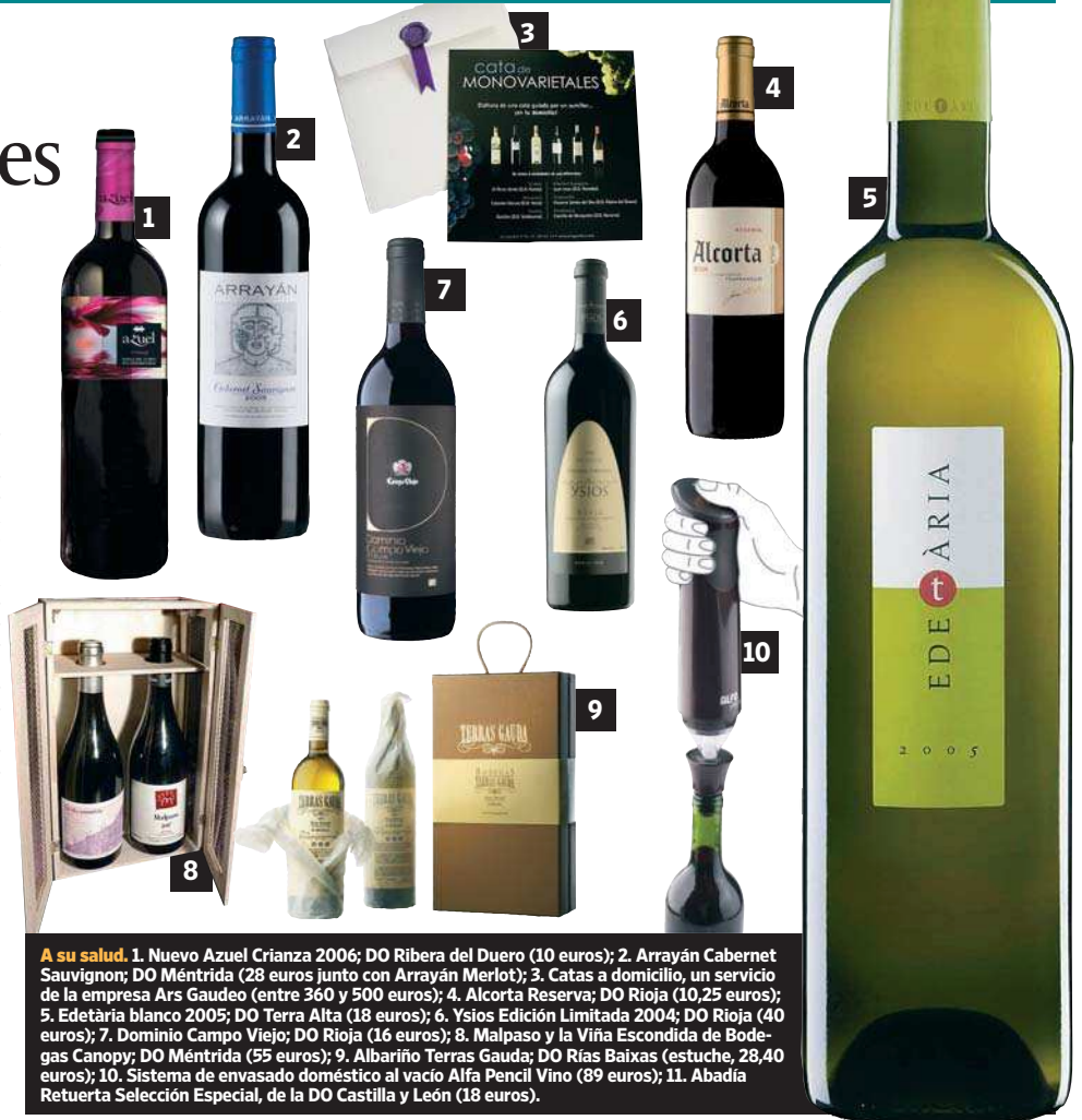
A su salud. 1. Nuevo Azuel Crianza 2006; DO Ribera del Duero (10 euros); 2. Arrayán Cabernet Sauvignon; DO Méntrida (28 euros junto con Arrayán Merlot); 3. Catas a domicilio, un servicio de la empresa Ars Gaudéo (entre 360 y 500 euros); 4. Alcorta Reserva; DO Rioja (10,25 euros); 5. Edetària blanco 2005; DO Terra Alta (18 euros); 6. Ysios Edición Limitada 2004; DO Rioja (40 euros); 7. Dominio Campo Viejo; DO Rioja (16 euros); 8. Malpaso y la Viña Escondida de Bodegas Canopy; DO Méntrida (55 euros); 9. Albariño Terras Gauda; DO Rías Baixas (estuche, 28,40 euros); 10. Sistema de envasado doméstico al vacío Alfa Pencil Vino (89 euros); 11. Abadía Retuerta Selección Especial, de la DO Castilla y León (18 euros).

No obstante, además de una botella de vino o dos, se agradece recibir también los complementos que conlleva, de cualquier precio y condición, que pueden redondear el regalo. Decantadores, juegos de copas, sacacorchos de diseño, cursos de cata, estuches, termómetros, tapones, anillas antigoteo, platos, cortadores, bonos de vino-terapia ... El mundo del vino es infinito. ♦